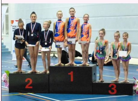
Onze benjamins voor het eerst op het podium.