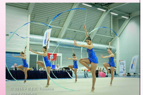
© 2016 • B.J.A. Treuren www.rgym.eu