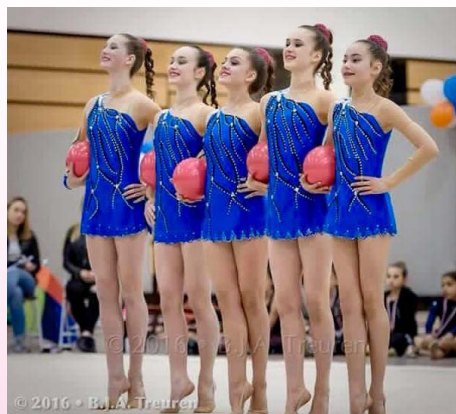
Een overtuigende eerste plaats voor de junioren.

Als laatsten kwamen de senioren in actie. Na hun Holland 's Got Talent-avontuur moesten zij weer snel omschakelen naar