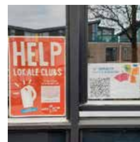
Posters op de ramen voor de online collecte voor Jantje Beton.