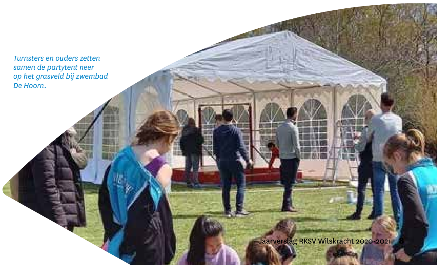
Turnsters en ouders zetten samen de partytent neer op het grasveld bij zwembad De Hoorn.