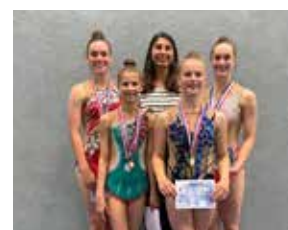
Eerste wedstrijd na 1,5 jaar geen. Onderlinge wedstrijd met de Badhoeve, OBQ, GTV Hilversum en TSA.