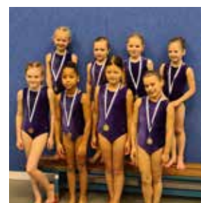
De allereerste wedstrijd voor onze jonge turnsters werd beloond met een mooie medaille.