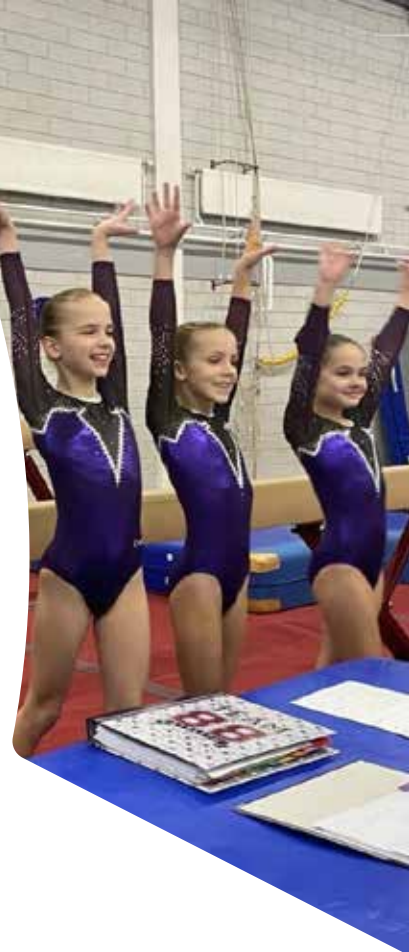
Corona teamwedstrijd vlak voor de lockdown voor onze turnsters.

Samengevat: een fraai en klantvriendelijk programma.