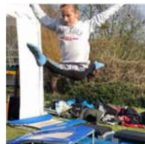
Buiten trainen op echte toestellen bij onze turntent op het grasveld van zwembad De Hoorn.

Wij roepen een ieder op om, waar mogelijk, ook een kleine taak op zich te nemen. Vraag bijvoorbeeld de trainster van je kind bij de aankondiging van een (onderlinge) wedstrijd, teamuitje of ander samenkomen eens of je ergens bij kunt helpen. Ook bij de hierna genoemde sponsoracties kun je je hulp aanbieden. Zo maken vele handen licht werk en creëren we clubgevoel.