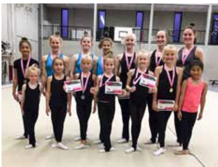
De meisjes van de Eerste Divisie deden in juli mee aan de Online Dream Cup waarbij een juryteam via een livestream de oefeningen beoordeelde.

Toen wedstrijden in juni weer werden toegestaan besloten we alles op alles te zetten om onze jaarlijkse onderlinge wedstrijd ondanks de zeer korte voorbereidingstijd te laten doorgaan. Voor de recreatiegroepen en Jong Talent met een mooie demo en voor de selectiegroepen een onderlinge wedstrijd. Zo kon iedereen het jaar toch nog op een leuke manier afsluiten.