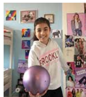
Online training tijdens de tweede lockdown.