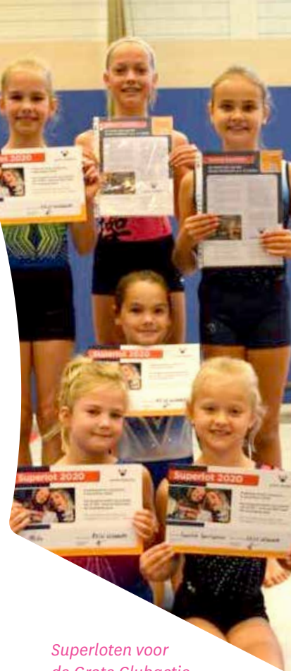
Superloten voor de Grote Clubactie.