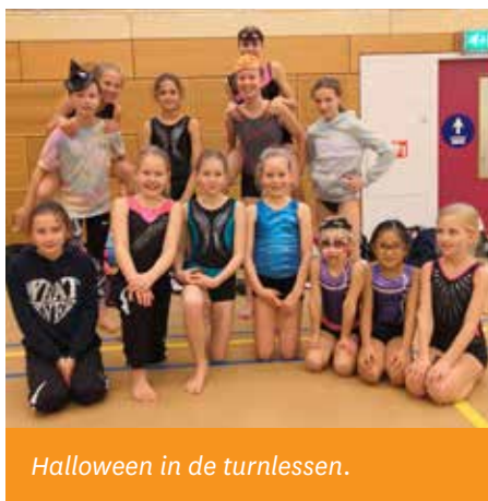
Halloween in de turnlessen.

Het seizoen 2020/2021 was een roerig coronajaar. We hebben een aantal lessen kunnen geven, maar ook een flink aantal niet. Doordat we een hele tijd stil hebben gelegen met deze groepen door de coronamaatregelen hebben wij een aantal leuke activiteiten digitaal verstuurd. Zo hebben we de 'Gym Bingo' en het 'nijntje Beweegalfabet' gedeeld met de kinderen van de gymgroepen. Ook hebben alle kinderen een nijntje tasje gehad met leuke nijntje dingen erin en een blad met oefeningen voor thuis.