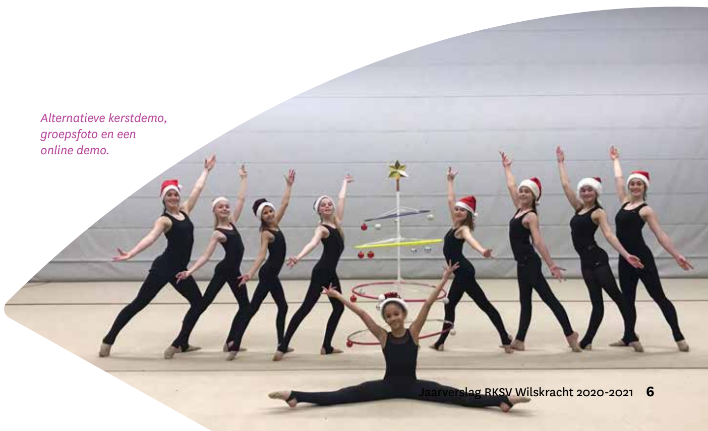
Alternatieve kerstdemo, groepsfoto en een online demo.