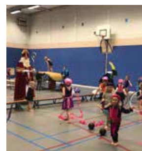
Sinterklaas en zijn pieten op bezoek bij Wilskracht.