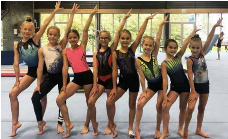
Selectieturnsters tijdens een open techniektraining in Amstelveen.

Om ook in de regen buiten te kunnen turnen met alle turngroepen en na een paar maanden ook weer op toestellen, is er een crowdfunding opgestart door ouders om een grote partytent aan te kunnen schaffen. Het bedrag was erg snel bij elkaar. Samen met ouders is de tent opgebouwd en ingericht. Alle turnsters, groot en klein konden weer op de balk, aan de brug en op de airtrack turnen.